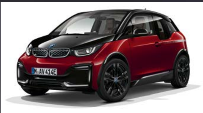
Metallic C6G Aventurinrot mit Akzent Frozen Grey metallic*