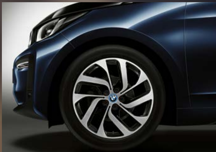
2G5 19" BMW i Leichtmetallräder Turbinenstyling 428, Jetblack, glanzgedreht