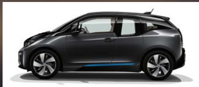
Metallic C2V Mineralgrau mit Akzent BMW i Blau