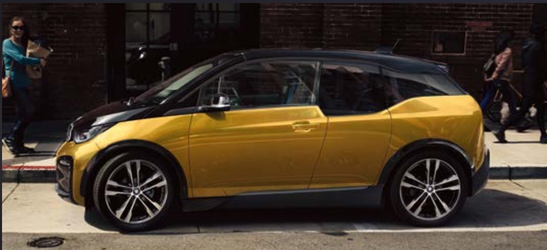
Metallic C4Y Galvanic Gold mit Akzent Frozen Grey metallic