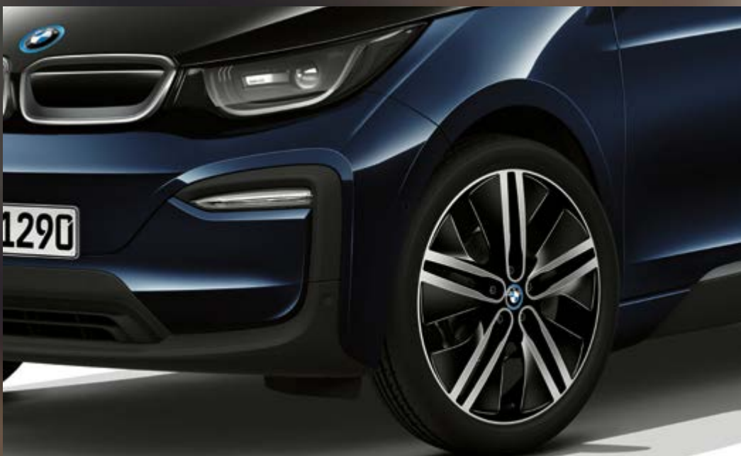
2T7 20" BMW i Leichtmetallräder Doppelspeiche 430, Jetblack, glanzgedreht