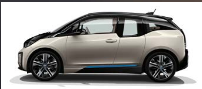
Metallic C4X Kaschmirsilber mit Akzent BMW i Blau