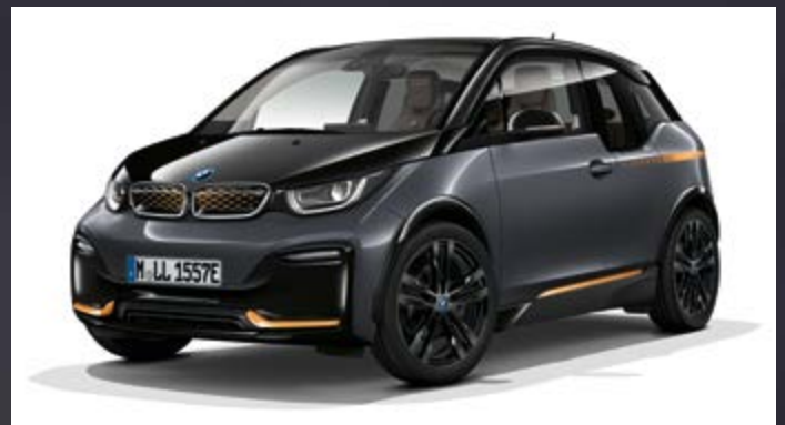
Metallic C6H Storm Bay mit Akzent Frozen E-Copper metallic*