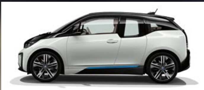
Uni B85 Capparissweiß mit Akzent BMW i Blau