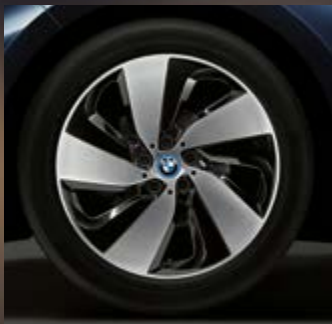
2G6 19" BMW i Leichtmetallräder Turbinenstyling 429, Jetblack, glanzgedreht