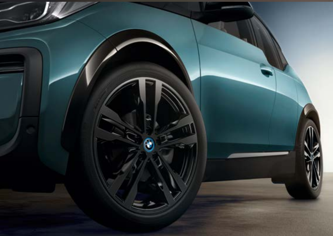
26K 20" BMW i Leichtmetallräder Doppelspeiche 431, Jetblack uni