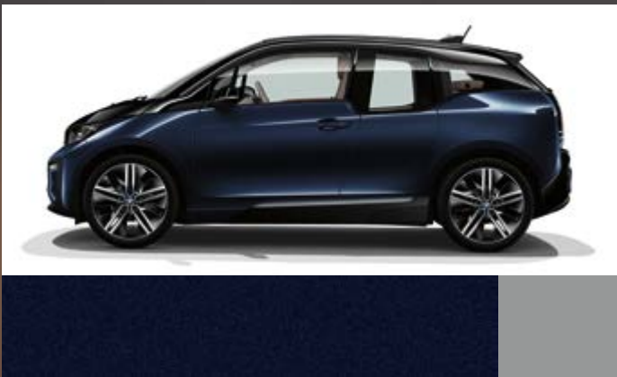
Metallic C1W Imperialblau mit Akzent Frozen Grey metallic