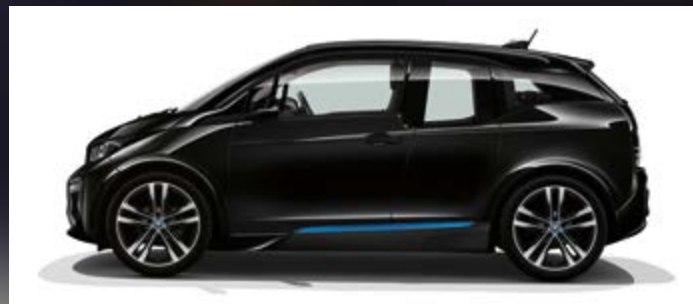
Uni C2W Fluid Black mit Akzent BMW i Blau