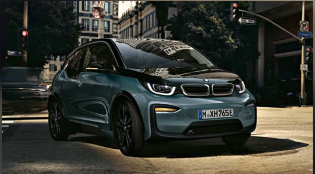
Metallic C4Z Blue Ridge Mountain mit Akzent Frozen Grey metallic