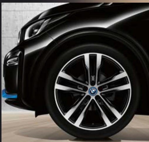
26N 20" BMW i Leichtmetallräder Doppelspeiche 431, Jetblack, glanzgedreht