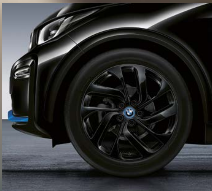
19" BMW i Leichtmetallräder Turbinenstyling 428, Jet Black