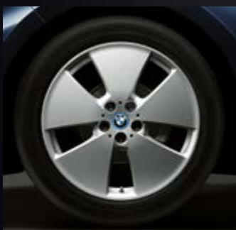
2D6 19" BMW i Leichtmetall- räder Sternspeiche 427, BMW Efficient Dynamics, Reflexsilber